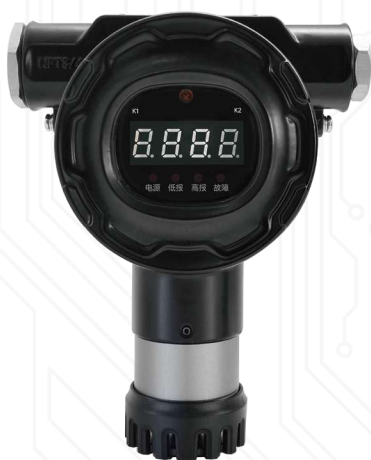
固定式气体检测仪

SG100系列是一款智能型热插拔的固定气体检测仪，真正的实现即插即用，使用现场维护更加简单方便。用于24小时在线检测环境中有毒有害气体浓度，采用两键式磁棒设计，实现在任何防爆区域都能对检测仪进行现场维护和操作。同时取得国际IECEX、ATEX和中国防爆三个防爆认证，防爆等级可达Ex db IIC T6 Gb/Ex db ia IIC T6 Gb/Ex da db ia IIC T6 Gb，本安级防爆性能，符合工业环境各项使用标准，为您的环境安全保驾护航。仪器通过了抗静电测试，防护等级：IP66/IP67。